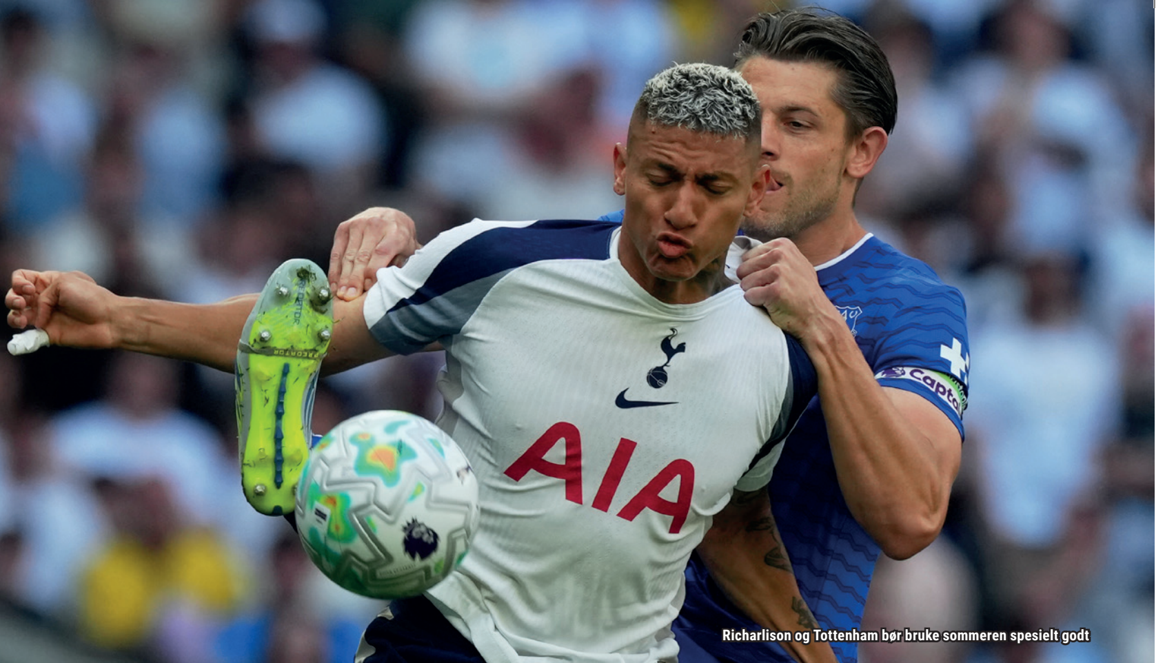
Richarlison og Tottenham bør bruke sommeren spesielt godt